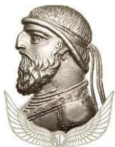
سکه ی مهرداد دوم اشکانی

در زمان مهرداد دوم ( پادشاه اشکانی) ایران به کشوری بسیار پهناور و قدرتمند تبدیل شد .